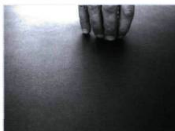
Il revient avec ceux-ci.