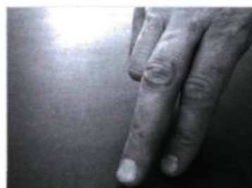
Fébrile, l'homme s'approche pour constater la mort de la bête.