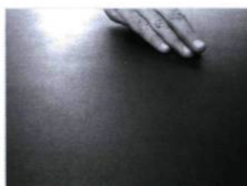
Ils arrivent au camp.