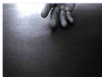
Tam di li dam dam, dam dam !