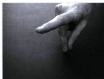
Épaulant sa carabine, il s'empresse de tirer deux coups.