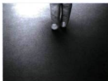
Un homme s'en va à la chasse.