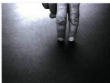
Il marche doucement dans les bois, à l'affût d'un détail.