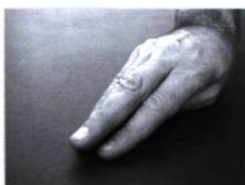
Ils entament le portage de l'animal.