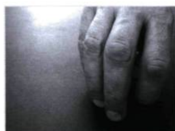
Les hommes dépècent la bête.