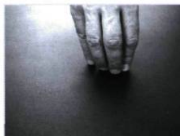
Ils entrent la bête gisant à proximité.