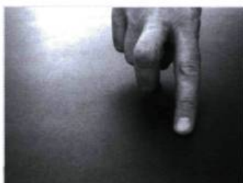
Il retourne au camp chercher ses amis.