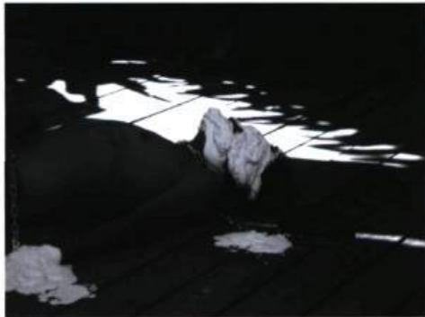
TIN MAUNG OO