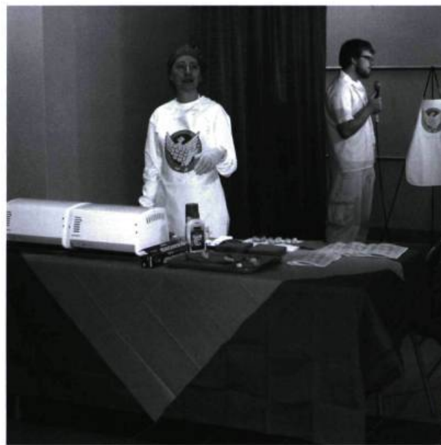
▲ subRosa, Cell Track: Mapping the Appropriation of Life Materials , 2004.