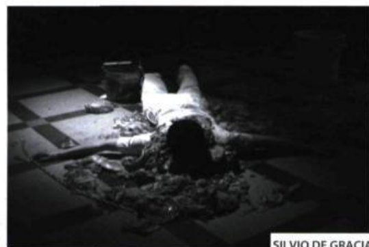
SILVIO DE GRACIA