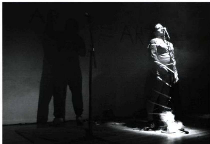
> Collectif ART (Action Terroriste Ridicule)