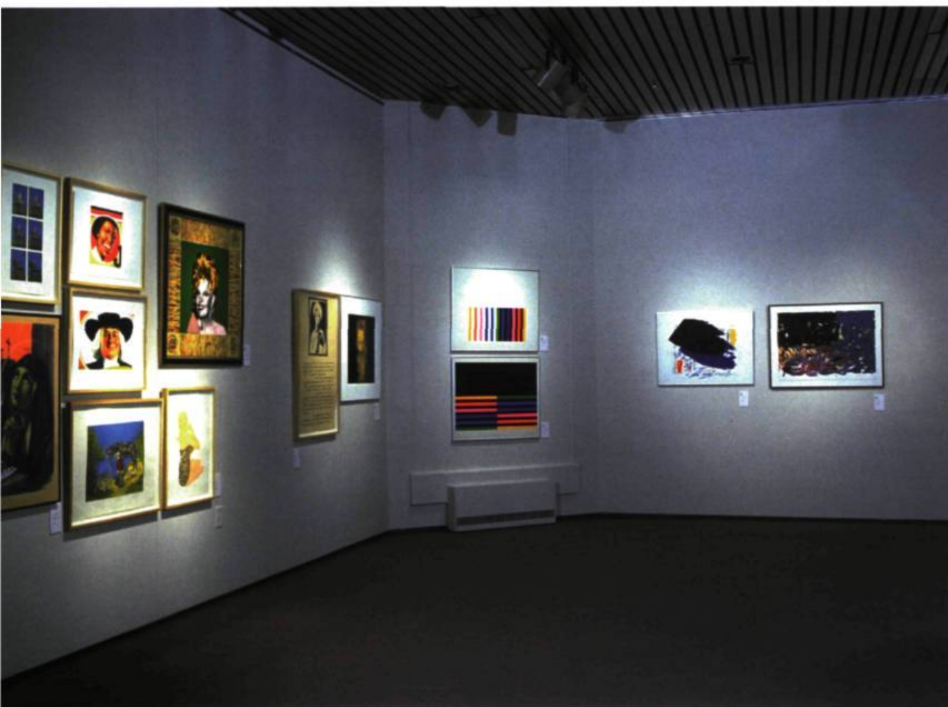
> Vue de l'exposition rétrospective 25 e anniversaire d'Engramme, centre d'exposition de la Bibliothèque Gabrielle-Roy, Québec, 1997.