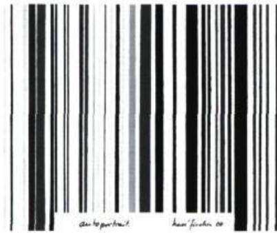
> Hervé Fischer, Autoportrait code- barres, 2000.