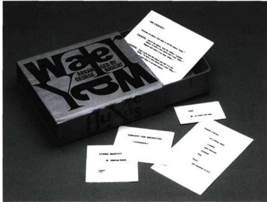
> George Brecht, Water Yam , 1963.

Or, l'objet de cet article est tout autre. En effet, ce que l'on appelle communément une relation désigne avant toute chose un processus cognitif, ce qui implique, dans le cas où l'on souhaiterait se questionner sur les enjeux relationnels de telle ou telle installation, pièce, performance ad lib. , de problématiser ses conditions de fonctionnement logique, sémiotique et pragmatique. En effet, au nombre des acceptions sémantiques du terme relation , dont l'origine vient du latin relatio , figure, outre le fait de relater, de rapporter quelque chose, le rapport entre deux (ou plusieurs) choses, entendu au sens logique d'une dépendance entre deux (ou plusieurs) termes, de telle sorte que toute modification de l'un entraîne nécessairement celle de l'autre (des autres). Partant de cette focalisation logique, il m'a également semblé que ces enjeux existaient exemplairement dans le travail de l'artiste George Brecht, pilier de la nébuleuse Fluxus et initiateur de l' event , devenu au cours des années soixante la forme générique de livraison publique des activités Fluxus.