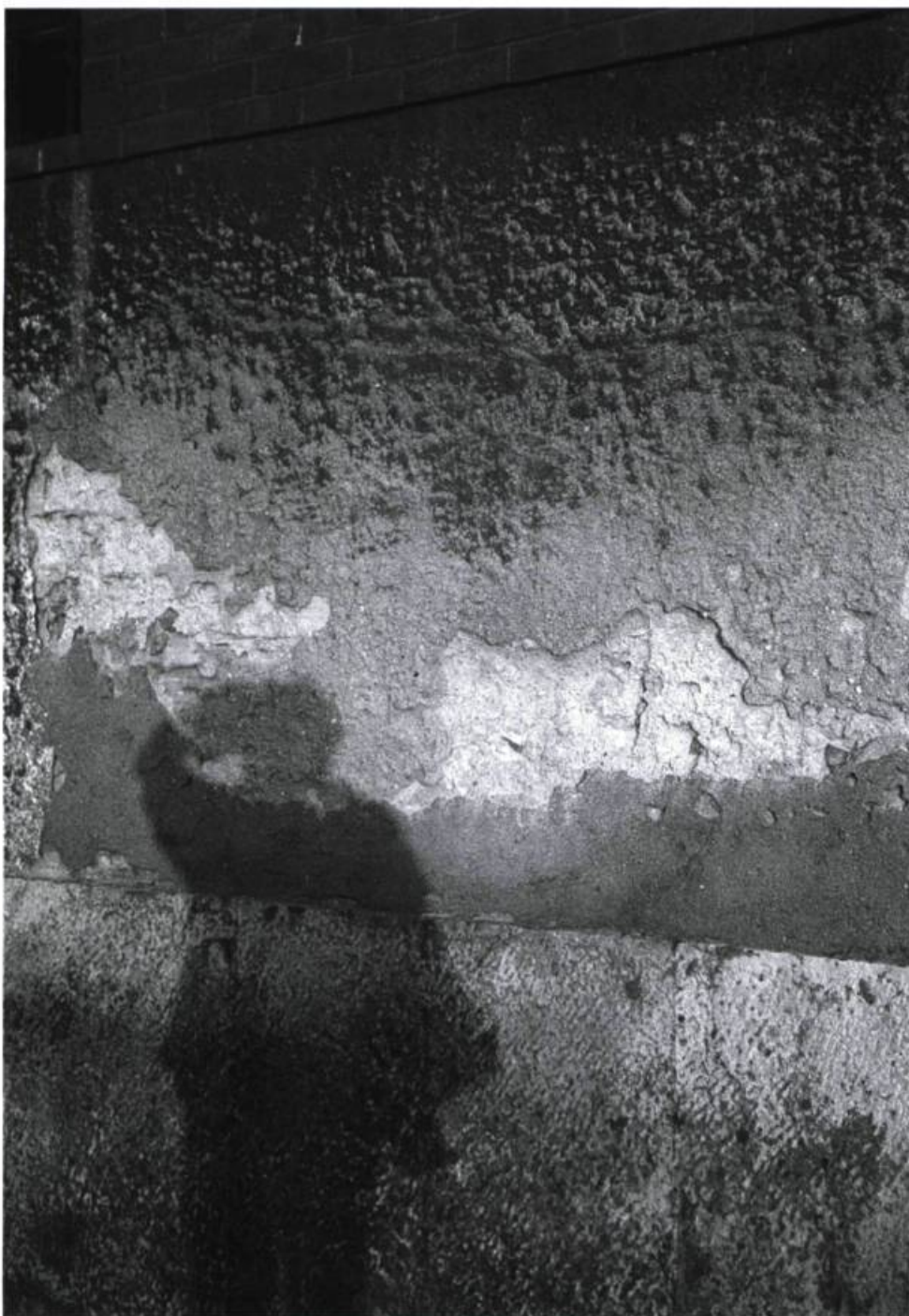
> Libonne, 1997