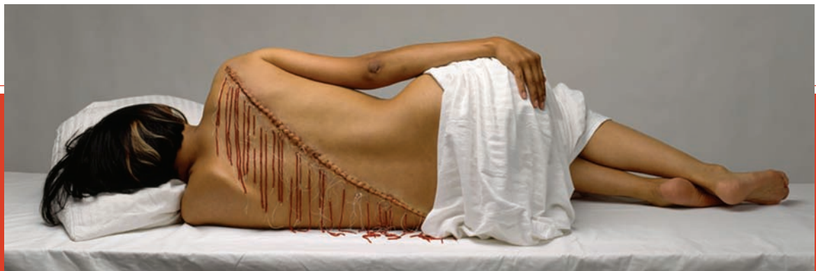
> Rebecca Belmore, Fringe , 2008.

Enfin, si le « Blanc » pensait comme l'« Indien », il ne vivrait pas pour un renouvellement perpétuel de soi et du présent à travers l'hyperconsommation. Si le Blanc pensait comme l'Indien, il ne ferait pas de la mémoire un instrument de récupération au profit d'un bien-être existentiel encore une fois limité à un présent immédiat. Non, si le Blanc pensait comme l'Indien, il vivrait en harmonie avec ce qui l'entoure. Il développerait une conscience globale en plaçant sa propre existence comme faisant partie d'une totalité. Il sèmerait des graines avec amour et vertu en sachant que ses enfants, ses petits-enfants et ses arrière-petits-enfants en récolteront les fruits. Enfin, pourrait-on se demander, que serait-il arrivé si l'homme blanc avait attendu que l'Indien l'invite à s'asseoir sur le billot plutôt que d'imposer sans respect sa présence ? Peut-être aurait-il écouté ce que l'Indien avait à dire. Peut-être aurait-il appris à le connaître. Peut-être auraient-ils pu admirer le Grand Fleuve ensemble. Peut-être, en fin de compte, auraient-ils pu se comprendre. «