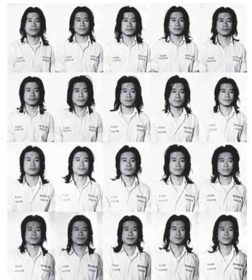
> One Year Performance 1978-1979, New York, 365 portraits, 1979.