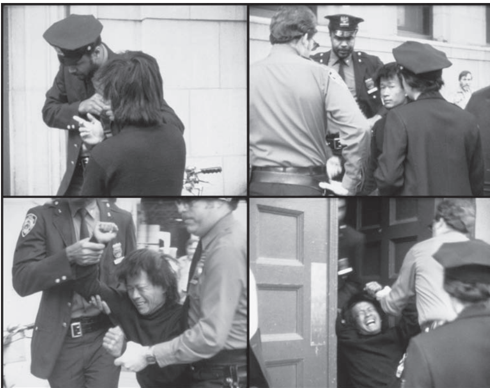
> One Year Performance 1981-1982, New York, arrestation (film super 8), 1982.

Avec les pièces Outdoor et Rope , le photo-conceptualisme très austère de 1980 a laissé place à un reportage documentaire sur le monde des sans-abris. Cette fois-ci, Hsieh a instauré une distance sociale qui le sépare du regardeur. Ce n'est plus l'ouvrier soumis à la temporalité mécanique, mais un nomade, un exclu, un outcast de la société s'abandonnant à un continuum qui n'est jamais contesté par des entrées et des sorties, des temps de repli et des temps d'exploration : c'est un continuum sans répéter, où les cycles des jours et des nuits ne sont plus des repères – des marqueurs de temps – dans la présence fluide 13 . Nous avons dit « sans-abri », « vagabond » ; nous pouvons dire aussi « intouchable ».