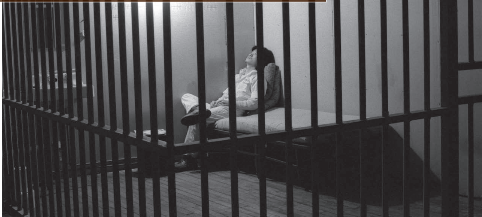
> One Year Performance 1978-1979, New York, 1979.

Les performances sont des mises en scène brèves et délocalisées de nos rencontres avec notre corps, le soi, la mort, la solitude, l'autre, la souffrance. Ces mises en scène se sont retirées des musées et des galeries. Elles requièrent néanmoins une visibilité : ce sont des formes d'art devenues dépendantes du relais photographique.