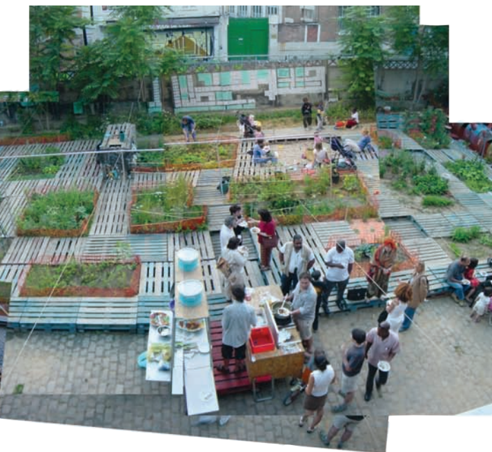
ECObox, Paris 18 e , quartier La Chapelle, site de la Halle Pajol, 2001-2005.