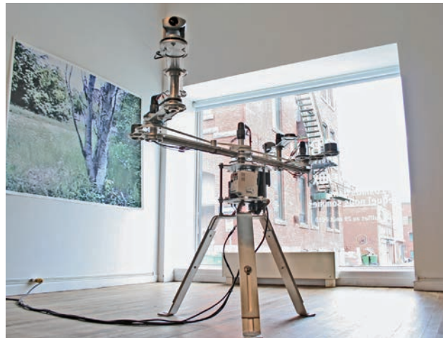
Pascal Dufaux, Le cosmos dans lequel nous sommes (Sculpture vidéo-cinématique#3), Sporobole, 2010.

Le dispositif capte l'espace pour en retransmettre l'image-mouvement, qui se trouve alors projetée sur le mur à grande échelle et en temps réel. À cela s'est ajouté un nouveau dispositif: la « Sculpture vidéo-cinématique#3 ». Précisons que cette dernière, telle que vue à Sporobole, était une version prototype, alors que la version finale fut exposée à Marseille dans le cadre du 23 e Instants vidéo à l'automne 2010. Ce troisième dispositif non seulement nous intègre, semblablement à la « Sculpture vidéo-cinématique#2 », mais il s'intègre lui-même dans sa propre captation spatiale. Il est double, il fonctionne comme un monstre à deux têtes qui, sporadiquement et sans aucune intentionnalité, en arrive à un point du système rotatif où les caméras se rencontrent et s'embrassent du regard, dans l'étrangeté et l'indifférence les plus totales. Le « regard » de ces caméras nous est retransmis par deux écrans de petits formats, placés côte à côte et sur lesquels nous pouvons suivre le mouvement rotatoire du système qui, tout en observant son environnement, s'observe également lui-même.