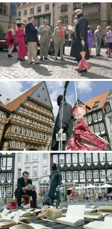
> Black Market International [Alastair MacLennan], Hildesheim, 2000.

À un autre moment de l'œuvre inscrite dans la durée, les membres de System HM 2 T (Helge Meyer et Marco Teubner) se sont mis nus et ont rasé tous les poils de leur corps durant un long processus. Après avoir fini de se raser, les deux artistes se sont serrés et cousus la main ensemble avec du fil chirurgical. Déjà, pendant l'action du rasage, il y a eu intervention de la police : il y avait eu de nombreuses plaintes de la part des gens qui prenaient un café dans les établissements environnants. Pendant la couture, la réaction des passants a empiré : les bénévoles du festival ont dû intervenir pour faire cesser les attaques agressives contre les deux artistes. Certains commentaires radicaux provenaient visiblement de passants adhérent