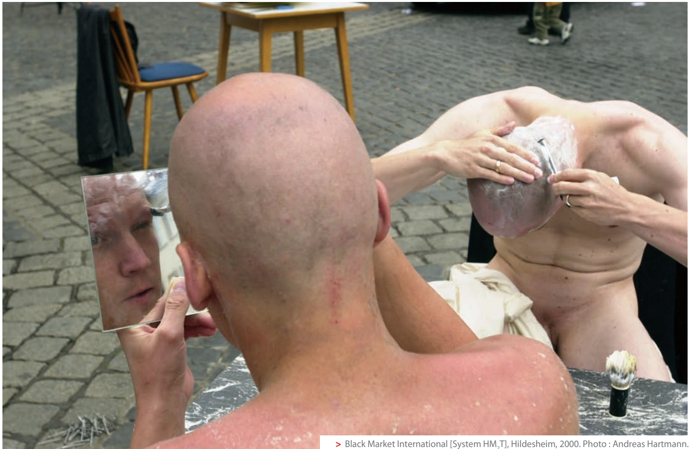
> Black Market International [System HM,T], Hildesheim, 2000.