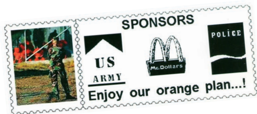
> Clemente Padín, Enjoy , série Spams Trashes .

La poésie performative, qui était auparavant exposée dans des espaces réels et tangibles, est elle aussi transformée profondément lorsque le réseau cybernétique devient un nouveau