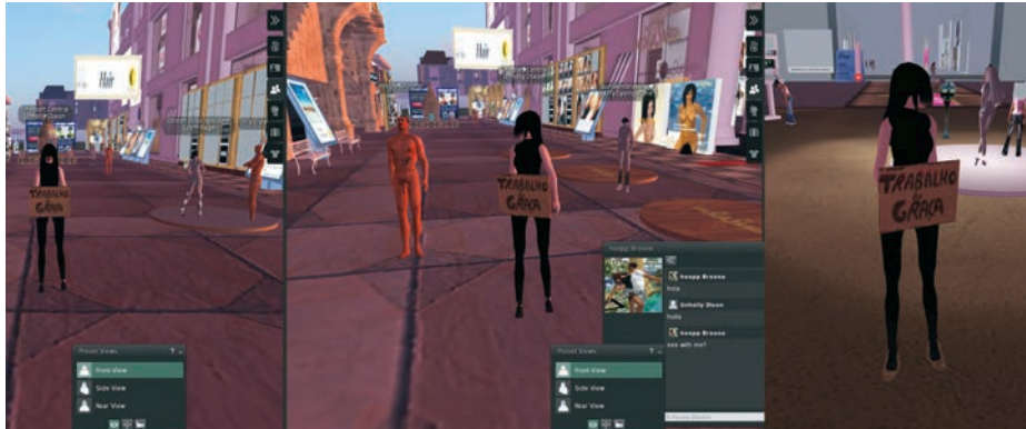
> Beatriz Albuquerque, Trabalho de Graça , Second Life , 2010.

linéaire par la syntaxe hypertextuelle, incitent la participation interactive et mènent le lecteur vers un processus inattendu de démocratisation des pratiques poétiques. Les poèmes collaboratifs et interactifs sont des entités privilégiées lorsqu'il s'agit d'élargir le domaine et l'usage du langage poétique par des moyens de création ouverts et non pas clos. L'interactivité constitue l'un des instruments les plus substantiels pour l'expérimentation poétique numérique.