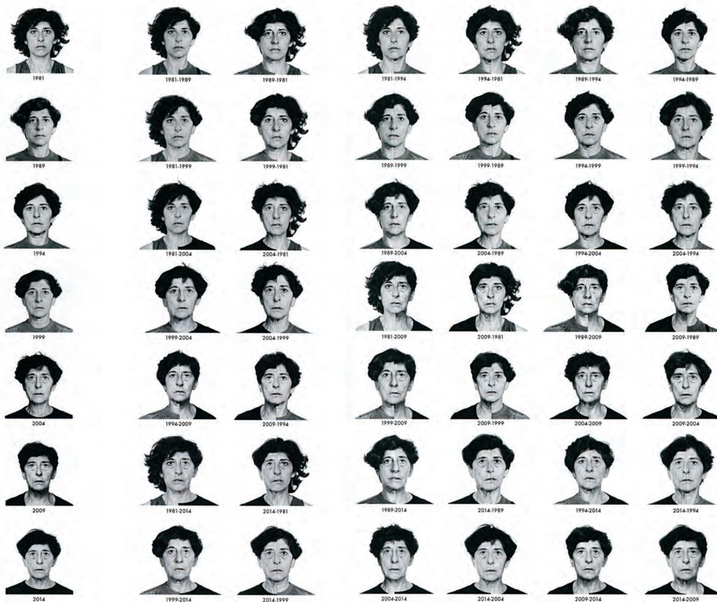
> Autoportrait dans le temps , 49 photos noir et blanc sur aluminium, 40 x 50 cm chaque, 1981-2014.