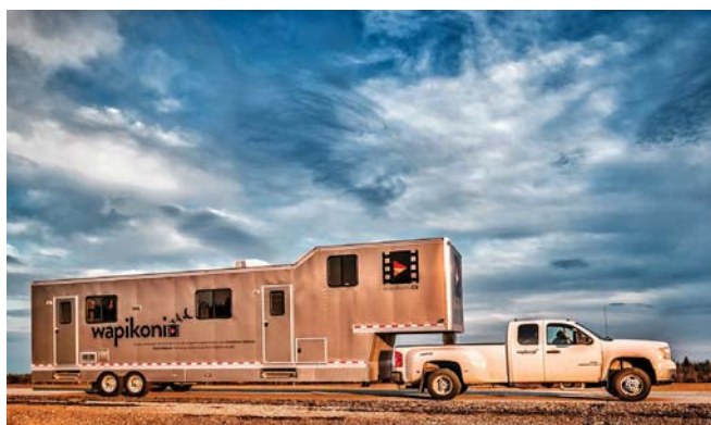
> Escale à Timiskaming, 2014.

Une autre alliance internationale de cocréation a été établie avec le Réseau international de création audiovisuelle autochtone (RICAA), un réseau représenté par 52 membres de 16 pays. Pour sa deuxième édition, ce réseau a engendré un long métrage collectif présentant des perspectives contemporaines sur la question des femmes, coréalisé par une quinzaine de cinéastes autochtones de différents horizons.