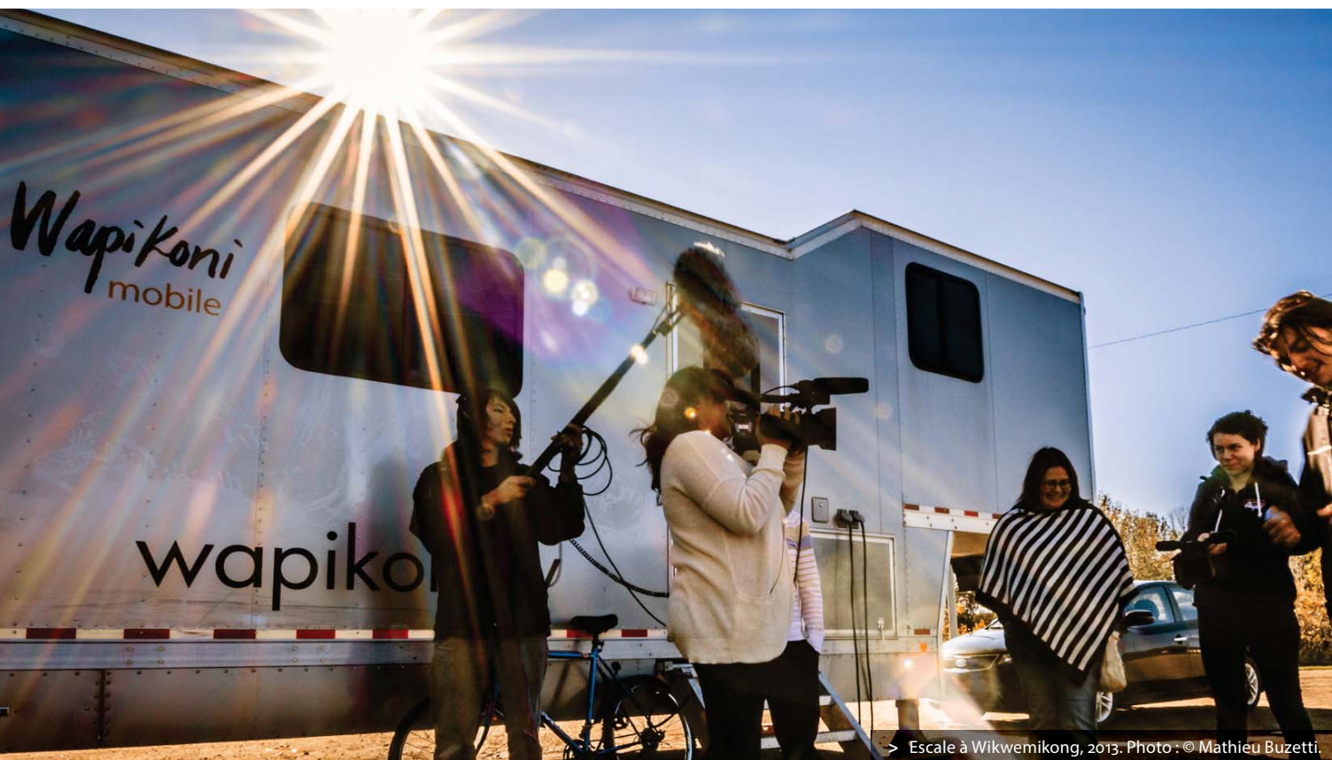
> Escale à Wikwemikong, 2013.

En 2003, le Wapikoni mobile est cofondé par Manon Barbeau, le Conseil de la Nation Atikamekw et le Conseil des jeunes des Premières Nations du Québec et du Labrador, avec le soutien de l'Assemblée des Premières Nations et la collaboration de l'Office national du film du Canada.