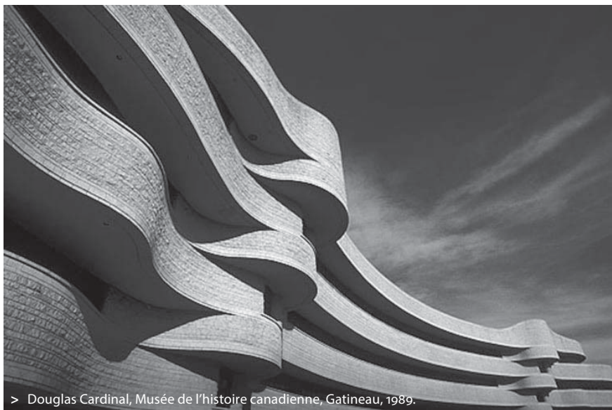
> Douglas Cardinal, Musée de l'histoire canadienne, Gatineau, 1989.