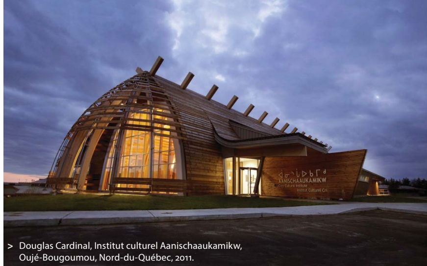
> Douglas Cardinal, Institut culturel Aanschaaukamikw, Oujé-Bougoumou, Nord-du-Québec, 2011.