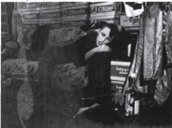
Phot'oeil François Bergeron