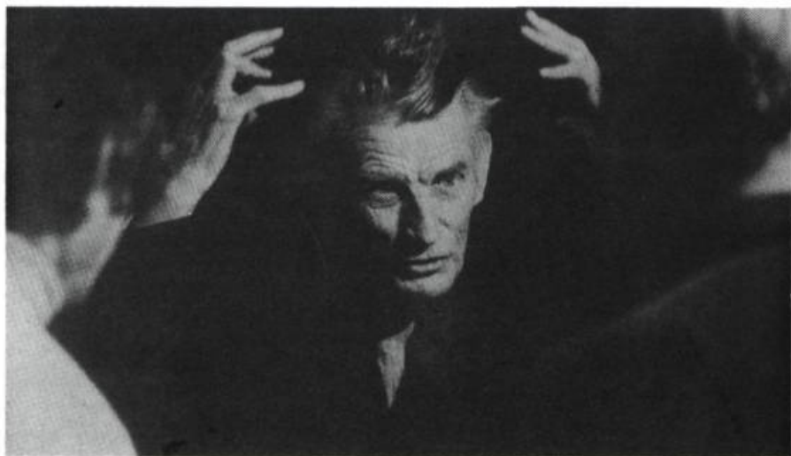
Samuel Beckett, metteur en scène de sa pièce En attendant Godot, au Schiller Teater, Berlin, 1975.