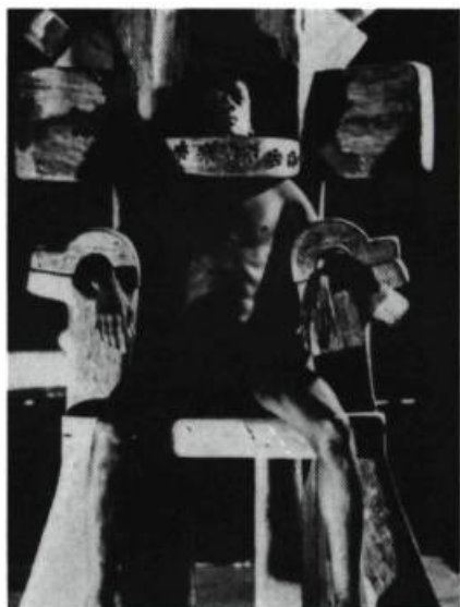
Et ils passèrent des menottes aux fleurs , texte et mise en scène de Fernando Arrabal, Paris, 1969.