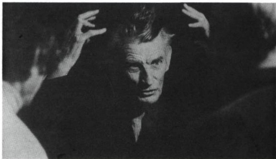
Samuel Beckett, metteur en scène de sa pièce En attendant Godot, au Schiller Teater, Berlin, 1975.