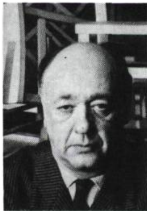
Eugène Ionesco.