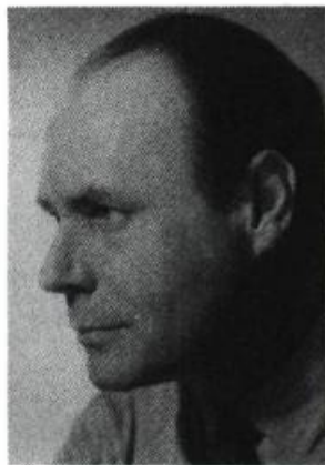
René de Obaldia.