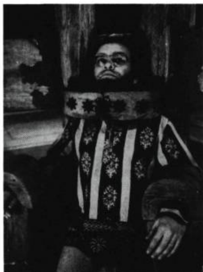
Fernando Arrabal pendant les répétitions de sa pièce ...Et ils passèrent des menottes aux fleurs , qu'il dirigeait lui-même. Paris, 1969.