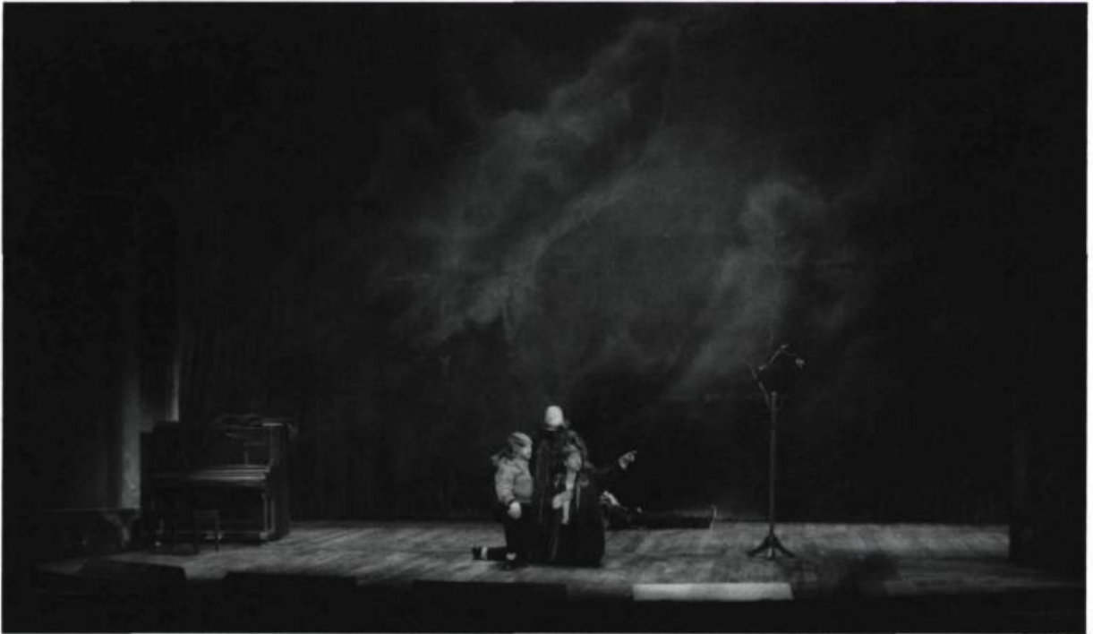
5. Cité par Georges Banu, «Le scénographe : un plasticien qui doute», Alternatives théâtrales , n° 12, juillet 1982, p. 62.

«Décor et scénographie, idéalement, commentent les textes. N'est-ce pas le cas de ce décor de Stéphane Roy, pour la mise en scène d'André Brassard?» En attendant Godot au T.N.M., en janvier 1992.