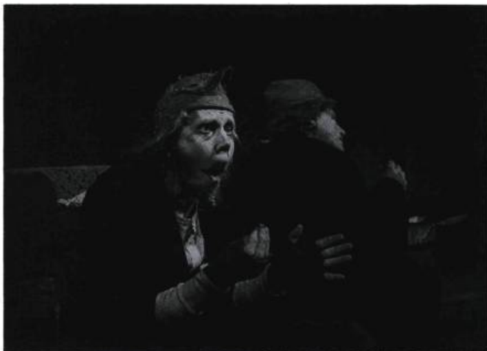
«Ranelot et Bufolet, deux héros d'Arnold Lobel, sont bien connus des jeunes lecteurs, de part et d'autre de l'Atlantique. Les mettre en scène représentait une incontestable gageure que le Skottes Musikteater (Gavle, Suède) a parfaitement remportée dans Paddan och Frodan .»

C'est Noël du T.U.Z. (Leningrad, URSS) nous a franchement ennuyé. Du théâtre-musée folklorique au service de bondieuseries archaïques, qui aurait peut-être sa place en animation de rue en période d'avent, mais pas dans un festival représentatif des tendances contemporaines du théâtre accessible aux jeunes publics. À souligner, cependant, la beauté plastique de certaines scènes et la maîtrise vocale des chants d'ensemble.