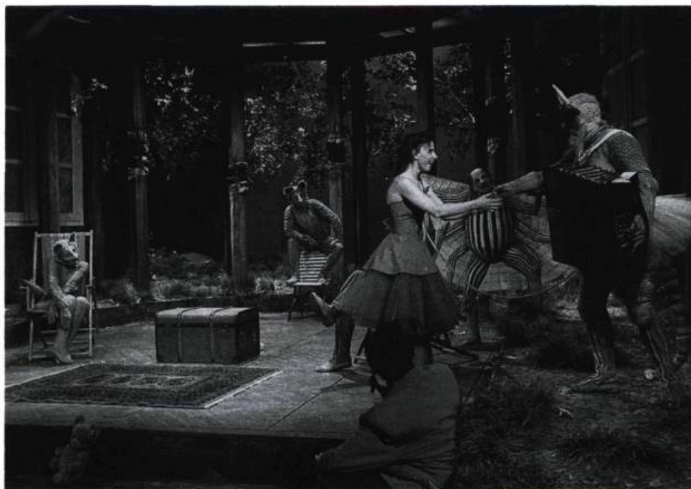
La scénographie de Danièle Bienz pour Mademoiselle Rouge de Michel Garneau, créée en 1989 à Genève, par le Théâtre Am Stram Gram, et reprise à la Maison-Théâtre en 1991. Werner Strub a créé les costumes et les masques des animaux fabuleux qui peuplaient cet univers.