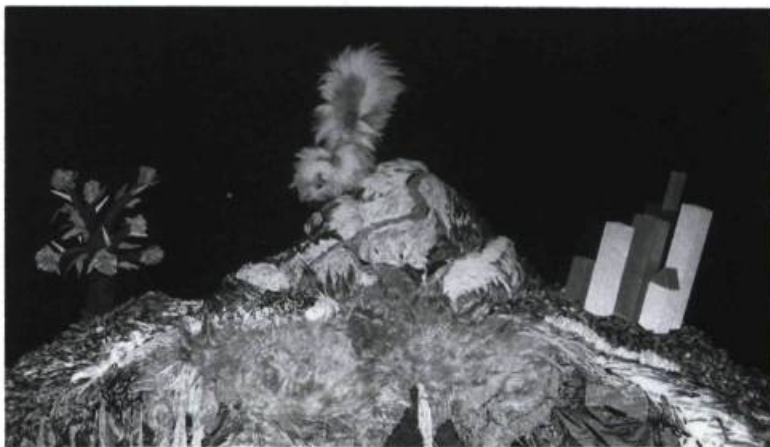
La mouffette et le rosier, marionnettes créées par Richard Lacroix pour Un autre monde du Théâtre de l'Œil.

Avant même que le spectacle ne commence, le décor, et parfois l'aménagement même de la salle, invitent à un recueillement; car il s'agit d'abord de faire apprivoiser aux enfants un lieu de spectacle et la communion avec d'autres enfants, de les entraîner dans un univers théâtral. Il y a un rituel de la représentation théâtrale auquel les enfants ne sont pas forcément habitués et qui doit être d'abord établi (souvent, un animateur viendra leur donner certaines consignes : silence à observer, applaudissements qui marquent l'appréciation, etc.). Le soin apporté à l'aspect visuel est d'autant plus important, dans les spectacles pour enfants, que ces derniers doivent être sollicités sur plus d'un plan, car leur intérêt est précaire. En outre, depuis le début des années quatre-vingt, les petits spectateurs de la génération Passe Partout, habitués aux vidéoclips et au zapping , imposent aux créateurs un défi exigeant et les placent devant un dilemme : jouer le jeu de cette hégémonie de l'image éclair 1 ou tenter de solliciter aussi le public par d'autres modes.