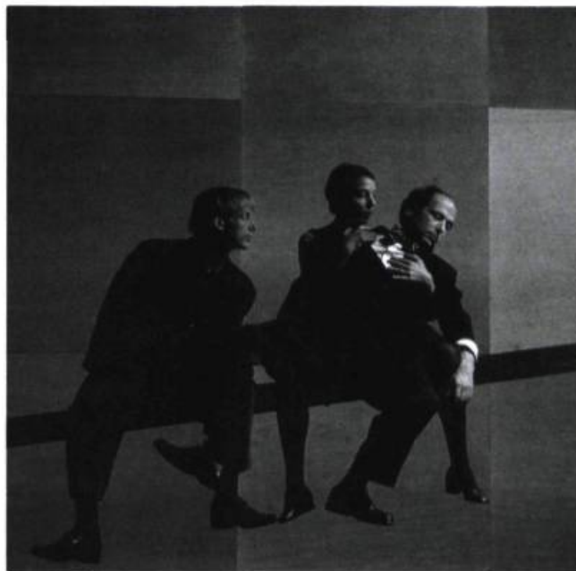
Adieux (1993).