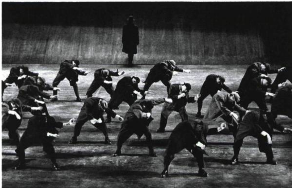
Joe (1983).

S'écartant de toute espèce de mystification narcissique, les corps de Perreault relèvent du discret, du secret, du non exhibé, et arborent tous un petit quelque chose de précaire et de fragile. D'abord taches sur le papier à dessin, puis mouvements structurés dans l'espace que construit le chorégraphe, ils sont plus que quotidiens et demeurent anonymes. Loin du glorieux, ces figures du hasard incarnent l'imperfection, le tout à fait normal . Mémoires et miroirs de nos sociétés pseudo-civilisées, elles ne se plient pas aux modes, ni même à la tentation de l'énergie victorieuse du vingtième siècle. Les corps de cet artiste semblent toujours être ceux de tout le monde , témoignant ainsi de l'ombre et de la réalité ; de la mienne comme de la vôtre.