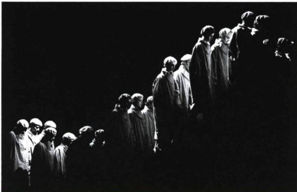
Stella (1985).

À travers ses innombrables représentations — gravé, joué, dessiné, sculpté, peint, dansé —, le corps s'enlace à l'image de l'éternité, à la pérennité des formes et des symboles, prend figure d'unité et de modèle sociaux et culturels, d'emblème du sensuel et du sexuel, de la vulnérabilité et de l'indivisibilité. À même la circulation fluide et mythique de la danse, il devient générateur d'images ou de fantasmes, matérialisation d'un renouvellement perpétuel, énergie fine ou brute, dévoilement de l'épiderme et expression discrète ou exacerbée de l'humain comme de l'animal. Dans la danse il prend racine, avec le geste il crée un royaume où s'incarne le désir ; d'amour, de chair, de vie.