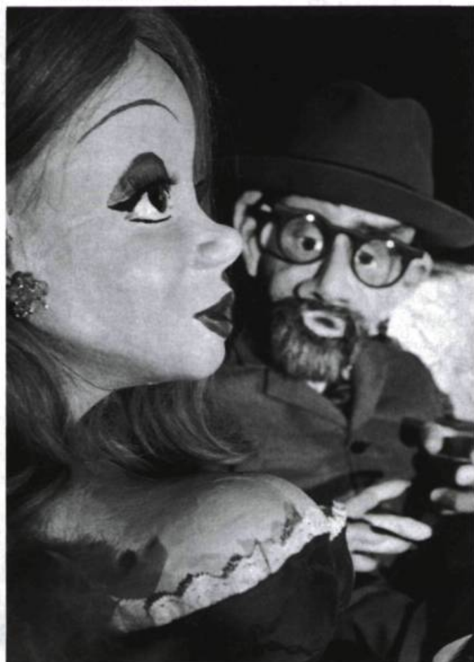
Les Enrobantes , Théâtre Pupulus Mordicus (Québec).

Freud est une des grandes figures pensantes de ce siècle, qui a nourri et les intellectuels et les clowns. Que le Théâtre Pupulus Mordicus, de Québec, ait voulu en faire une marionnette, au sens propre, n'est qu'un pas de plus pour faire connaître le psychanalyste et vulgariser la science qu'il a aidé à mettre au monde. Le sujet (si peu) audacieux abordé dans le spectacle les Enrobantes n'est nul autre que la sexualité, une des légendaires obsessions du barbu viennois. Les créateurs de « marionnettes pour adultes » (XXX !) se sont dit que le vrai Sigmund Freud n'était, lui, pas fait de bois et qu'il pourrait bien, comme tout le monde, manquer de mine dans le crayon. On a donc lancé le personnage à la recherche d'un remède contre l'impuissance. Ce qui fait sourire dans une telle pièce, c'est