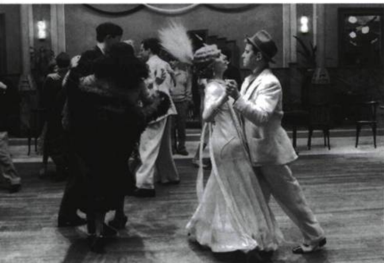
Le Bal, film d'Ettore Scola, réalisé à partir du spectacle du Théâtre du Campagnol.

Montrer la salle, vide ou peuplée, voire les coulisses, devient même une stratégie de reconstruction de la théâtralité, dans la mesure, peut-être, où la salle est la grande absente de l'histoire du cinéma. Le cinéma prend ainsi conscience de sa véritable