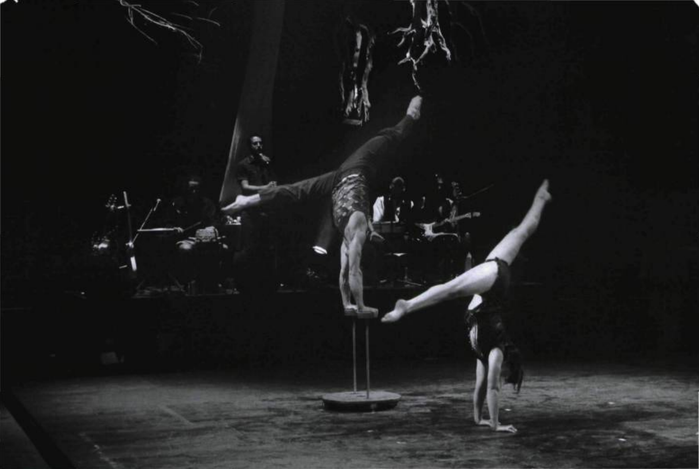
Projet Fibonacci , spectacle des 7 doigts de la main, présenté à la Tohu en juillet 2008.

main. Dix-neuf artistes en scène – cinq musiciens et quatorze circassiens – mettent à profit leur talent dans plusieurs disciplines : manipulation et jonglerie, équilibre, corde lisse, sangles, tissus, roue Cyr, acrobatie au sol, body-percussion , chant de gorge, musique, projection vidéo.