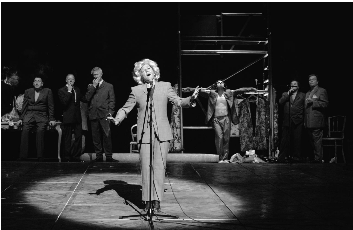
Gardenia d'Alain Platel et Frank Van Laecke. Spectacle des Ballets C de la B, présenté au Carrefour et au FTA 2011.

témoins de l'anamorphose de l'image de l'homme devenant femme, de la métamorphose du travesti, de la manière dont la chenille devient papillon, ce qui ajoute bien sûr une dimension émotive encore plus forte. Nous saisissons ainsi le manque, ce manque qu'est le vieillissement. Et la dégénérescence du corps est alors amplifiée par le tableau extraordinaire d'un jeune Apollon musclé, danseur exceptionnel au corps dénudé mis en tension avec une danseuse entre deux âges. Cette scène vient multiplier l'effet dévastateur de l'âge. Comme si la beauté espérée, la quête du corps parfait était pulvérisée dans cette exquise métaphore. Il exalte par sa vitalité farouche teintée par à-coups de gestes ratés une décrépitude incontournable qu'illustrent les travestis abattus par la vieillesse. Elles sont immobiles et songeuses, ces fleurs flétries, encore une fois remuées par le vent de fraîcheur du jeune danseur, celui qui incarne leur désir le plus profond, mais qui ne peut leur rendre leur jeunesse.