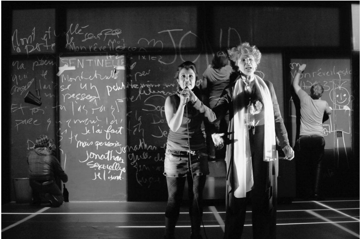
S'embrasent de Luc Tartar, mis en scène par Eric Jean (Théâtre Bluff, 2009). © Caroline Laberge.