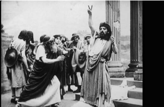
Mounet-Sully dans la Légende d'Œdipe , adaptation cinématographique d' Œdipe roi de Sophocle par l'acteur, réalisée par Gaston Roudès (1913).

incidente à une réforme de la déclamation théâtrale. Des outils ont permis de mesurer avec fiabilité la matière vocale : la parole a été analytiquement décomposée en ondes, durées, hauteurs et fréquences. L'enjeu était de décrire et de restituer les manières de dire, la manière de l'acteur constituant dans cette démarche un modèle particulièrement remarquable. Entre 1907 et 1908, deux séances ont rassemblé à Paris un savant et une « bête » de scène, plus précisément l'acteur Mounet-Sully, pour théoriser phonétiquement sa diction, pour savoir enfin comment il disait. Or, malgré le raffinement des outils de mesure, sa voix a montré quelque résistance, par ses variations infimes, à cette modélisation scientifique. De quoi alimenter plus encore les fantasmes à propos de la voix.