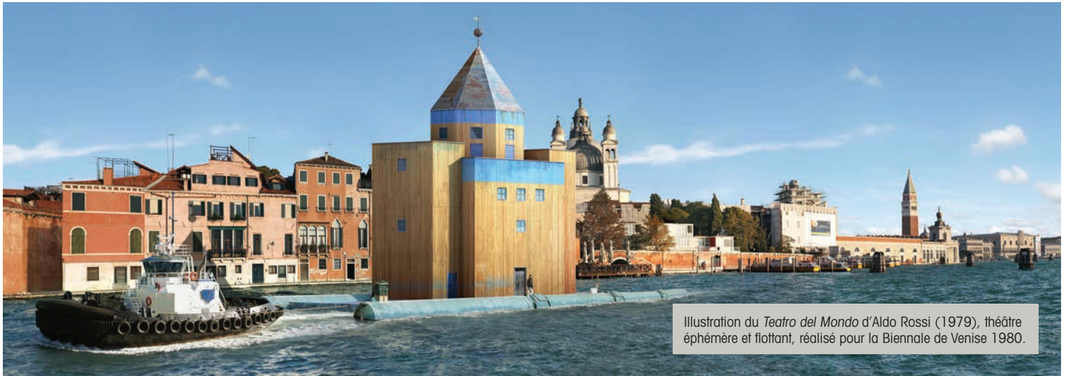
Illustration du Teatro del Mondo d'Aldo Rossi (1979), théâtre éphémère et flottant, réalisé pour la Biennale de Venise 1980.