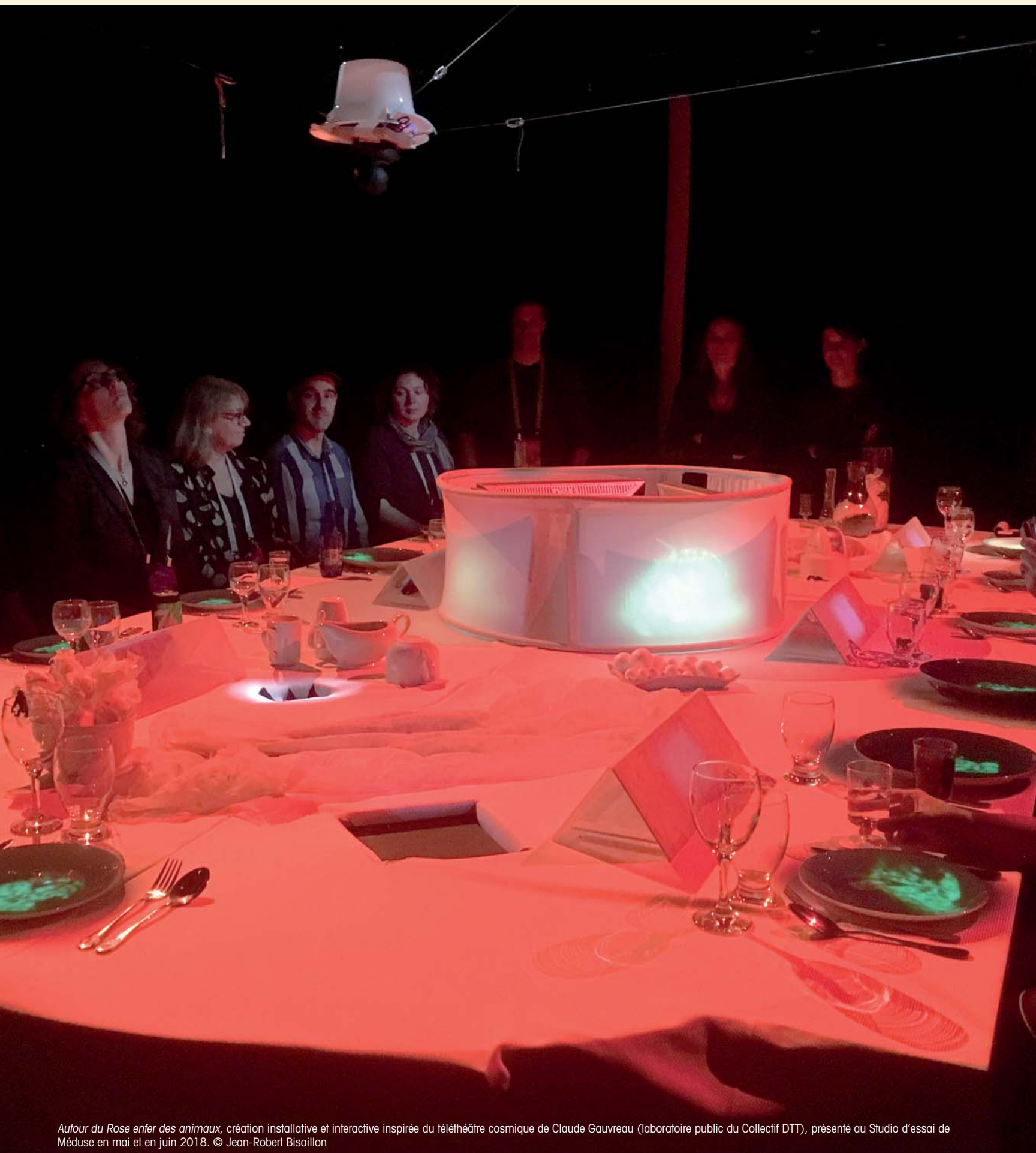
Autour du Rose enfer des animaux , création installative et interactive inspirée du téléthéâtre cosmique de Claude Gauvreau (laboratoire public du Collectif DTT), présenté au Studio d'essai de Méduse en mai et en juin 2018.