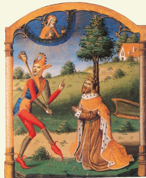
Le roi David et un fou, enluminure extraite du Psautier de Charles VIII, roi de France (Bibliothèque nationale, Paris).

Le clown fera bientôt son apparition au cirque par la petite porte. À la fin du 18 e siècle, il est d'abord accessoire aux spectacles dont l'essence est équestre. Comme il faut bien faire souffler les chevaux et changer leurs apparats pour en mettre plein la vue au public, le créateur du cirque moderne, Philip Astley, fait appel