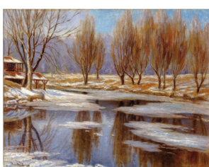
Maurice Séguin : le sens de l'héritage