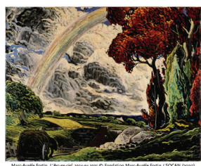
Saisir la crise