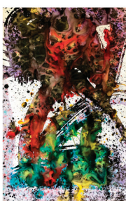
Brexit et Catalogne Les voies inconnues