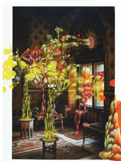
Français Reprendre l'initiative