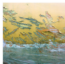
Immigration Qui contrôle quoi?