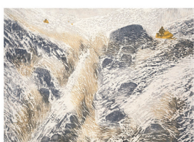
Les régions du Québec ont un rendez-vous avec elles-mêmes