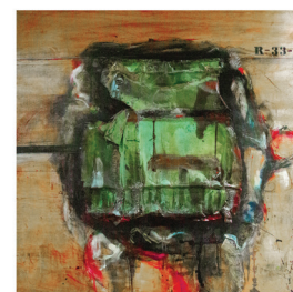
Langue et démographie Avis de tempête