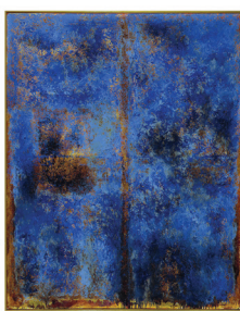
L'identité constitutionnelle autochtone