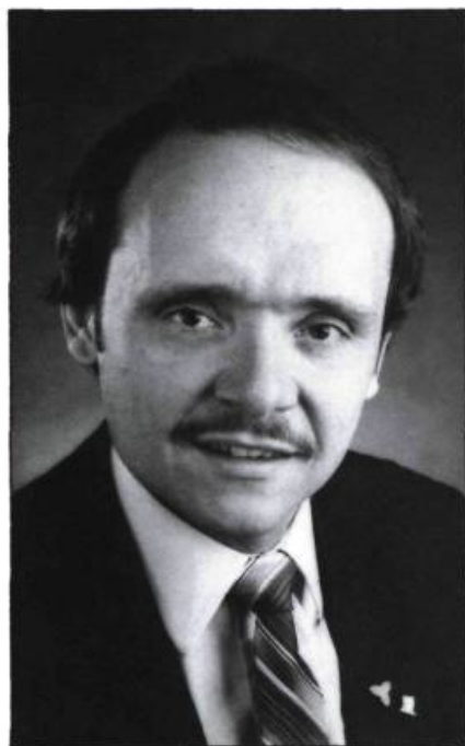
Don Boudria, député de Prescott-Russell