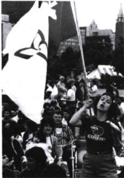
Le Festival Franco-ontarien d'Ottawa: de plus en plus, en envergure nationale.

Du 15 au 24 juin, le Festival franco-ontarien d'Ottawa célébrera son dixième anniversaire. Le marché By, le carré Cartier, le parc de la Confédération et le Centre National des Arts seront les principaux sites d'une foule de festivités. En fait, sous le thème de « 10 ans d'atmosphère ... », le cœur de la Capitale s'anima à la grandeur de cette décennie.