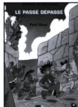
Paul Roux, Ariane et Nicolas : Le passé dépassé , Les Éditions Mille-Îles, coll. BD Mille-Îles, Montréal, 2001, 40 pages

Dans Le passé dépassé , Ariane et Nicolas ont à nouveau recours à leur miroir magique, qui leur permet de visiter les univers qui émanent de leurs pensées, pour voyager cette fois-ci dans le temps : de la Grèce antique en passant par le Moyen-Âge jusqu'à la Nouvelle-France du XVII e siècle. Ils devront affronter au fil de leurs aventures le Minotaure (créature de forme humaine à tête de taureau), les Anglois , les Anglèches (sic) et les Iroquois, respectivement. Roux en profite pour noter comment les dif-