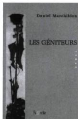
Daniel Marchildon, Les géniteurs , Ottawa, Le Nordir, collection «Rémanence», 2001, 196 pages.