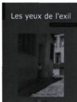
Aurélie Resch, Les yeux de l'exil , Ottawa, Le Nordir, 2002, 96 pages.