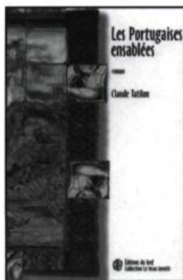
Claude Tatilon, Les Portugaises ensablées , Toronto, Éditions du GREF, collection «Le beau mentir», 2002, 155 pages.