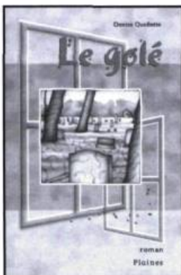
Denise Ouellette, Le golé , Saint-Boniface, Éditions des Plaines, 2002, 127 pages.