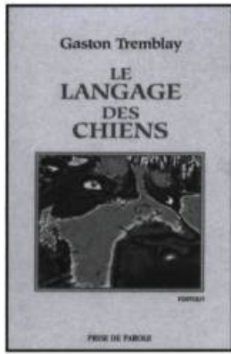
Gaston Tremblay, Le langage des chiens , Sudbury, Prise de parole, 2002, 185 pages.