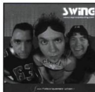
SWING - Folkloriquement urbain