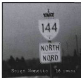
SERGE MONETTE - 18 roues