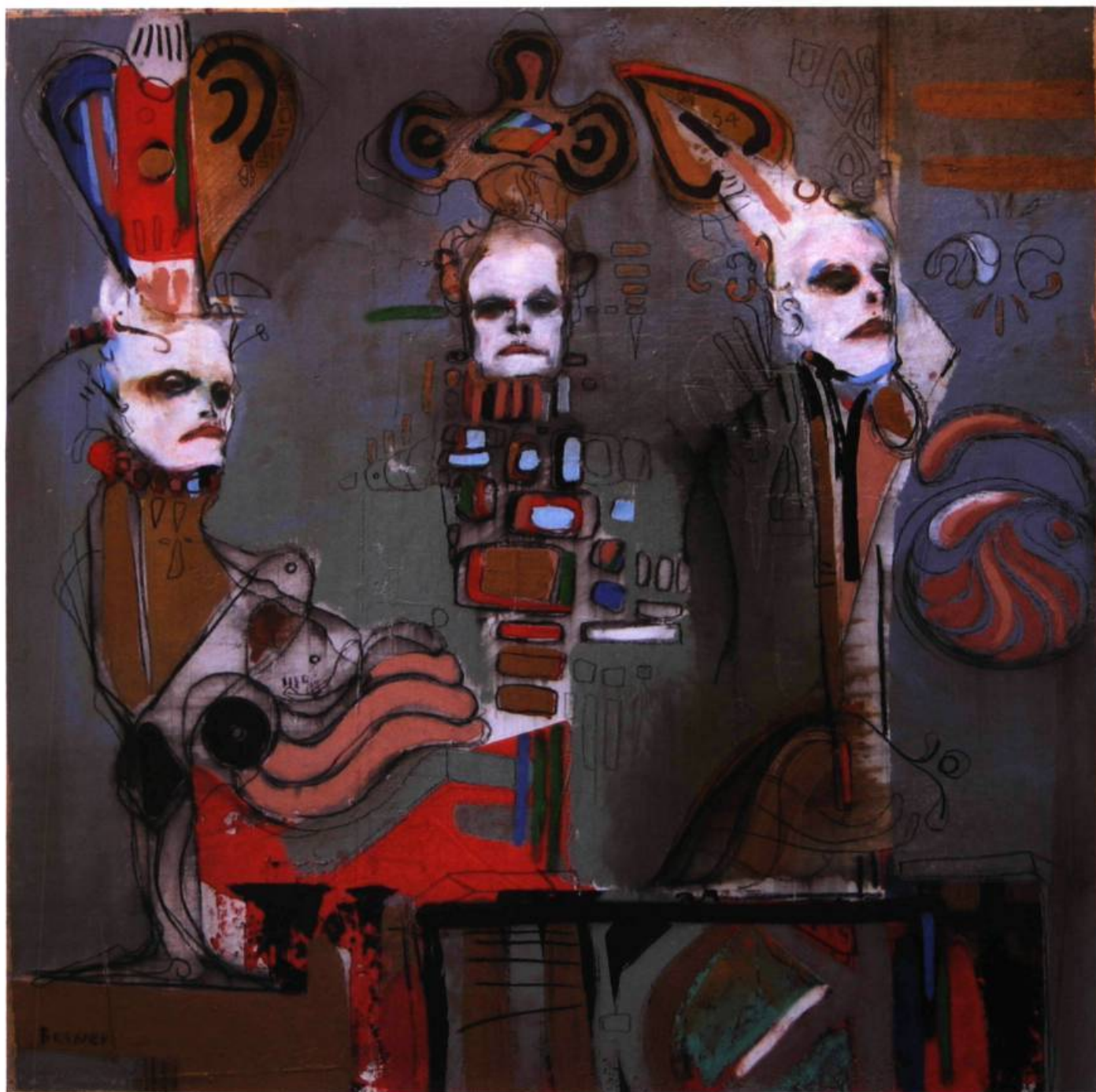
Les fritz du kasino (2005) Techniques mixtes sur toile, 30 X 30 pouces