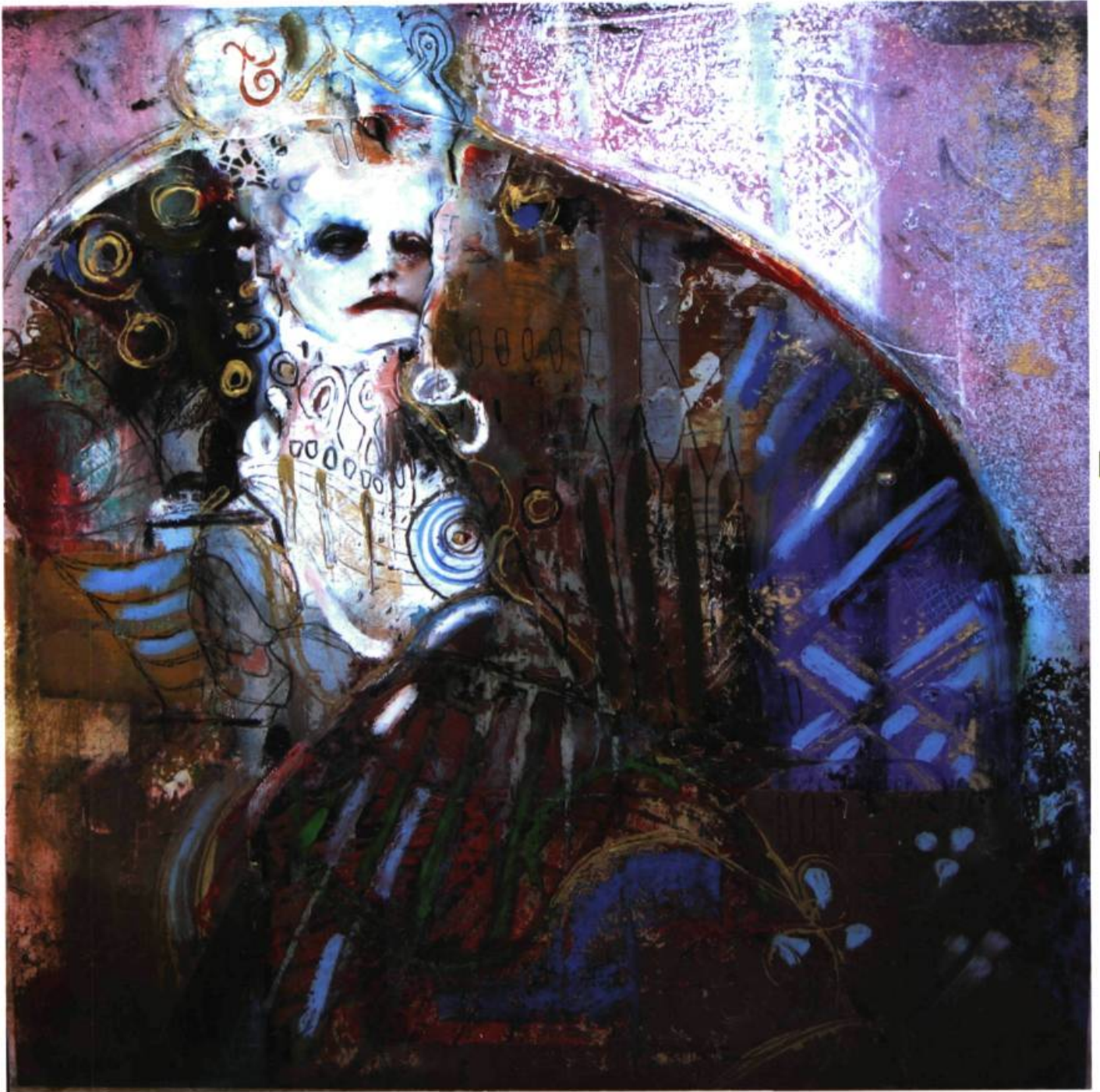
Petit jardin d'Ophrys (2005) Techniques mixtes sur toile, 20 X 20 pouces