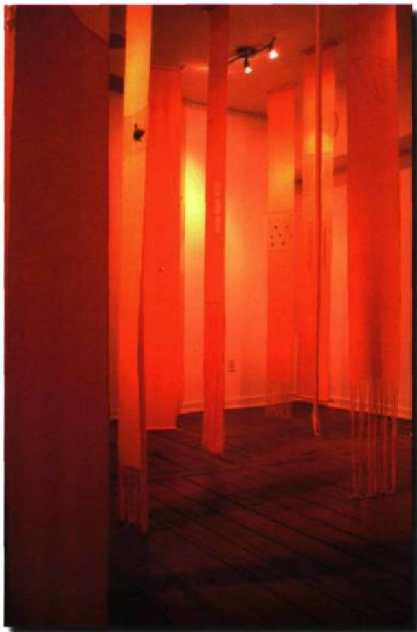
EN HAUT ET EN BAS Détail de La moisson II 12 po X 11 pi Tissage de coton sculpté — objets trouvés 2007