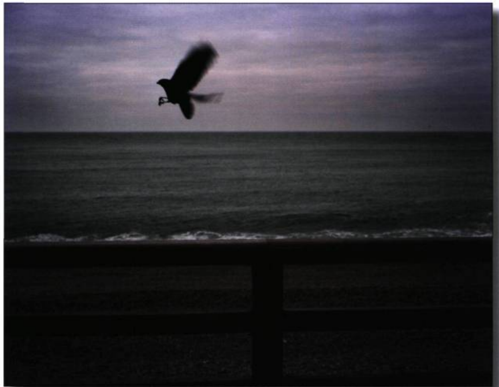
Caux Tirage au jet d'encre 63,5 x 73,6 cm Etretat, France, 2003

pertinent dans ce musée où on ne glorifie pas la guerre. L'espace d'exposition restreint incite le public à regarder de près les détails des photographies, à se plonger dans l'instant précis de ce moment d'histoire et à mieux ressentir l'atmosphère émouvante des images.