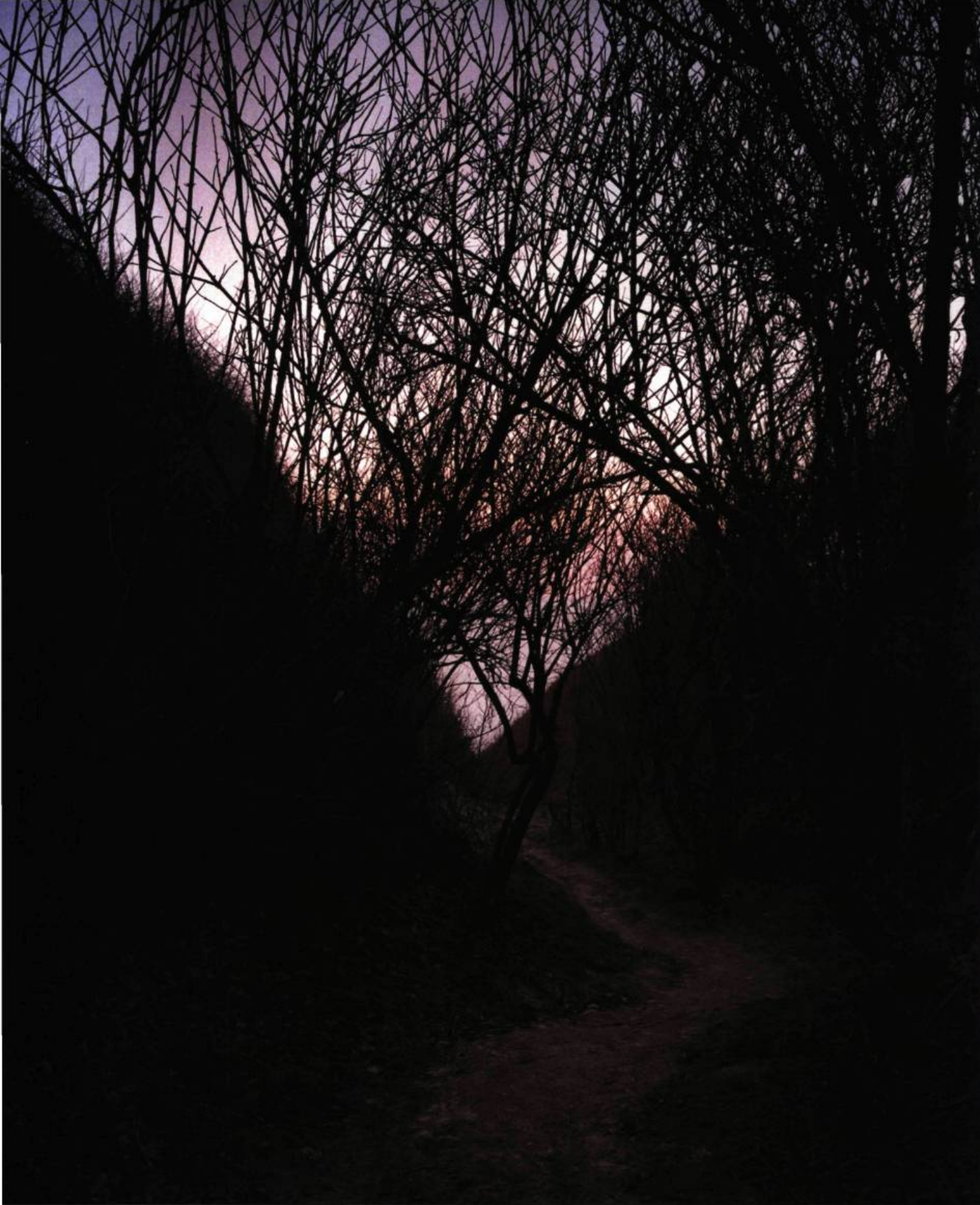
Caux Tirage au jet d'encre 81 x 122 cm Varengville, France, 2003