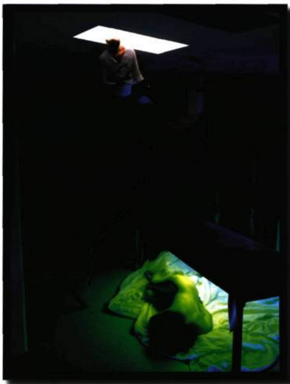
Détail de l'installation Classe d'art 010 , 2008

graphie analogique ont marqué les débuts de Marc Audette. La beauté est un terme souvent galvaudé, une notion souvent évoquée mais qui demeure très difficile à définir en art. Parmi les embûches que l'art numérique doit surmonter, celle-ci en est une de taille. Ce médium est basé sur les notions de beauté telles que convenu dans le langage populaire puisqu'il est utilisé surtout par les compagnies commerciales et destiné à un large public. Comment améliorer la qualité donc la beauté, ici la netteté de l'image numérique. On essaie de répondre à ces attentes (ou à remplir les coffres des compagnies) en améliorant les logiciels existants ou en créant d'autres, soit-disant plus performants. Surfaces sensibles , sous le thème principal de l'eau, traite de cette réflexion et ce questionnement. La couleur bleue, les dédoublements d'images amenés par la projection vidéo causant de la réverbération et l'interaction du spectateur sur les éclaboussements de lumière du mur opposé évoquent des vagues et sont des indices nous menant subtilement à la perception de formes fluides. La beauté est présentée lumineuse, colorée de rouge et de bleu éclatant et impressionnant.