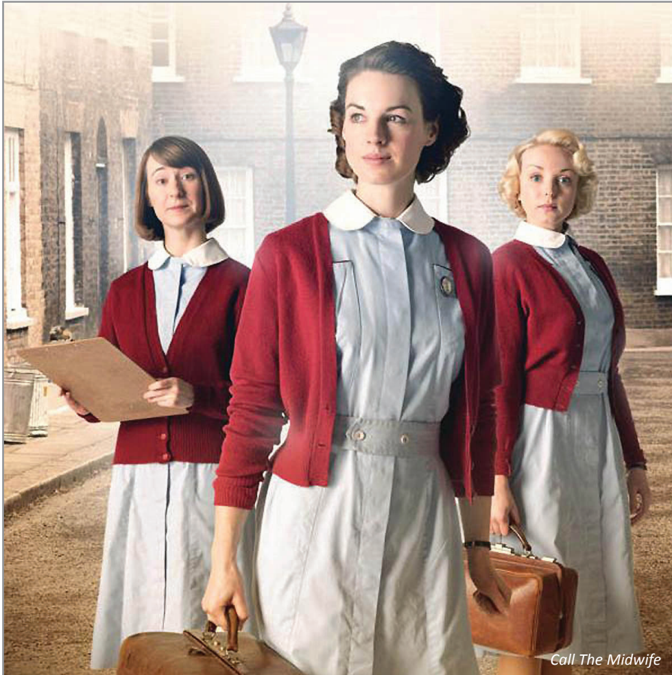
Call The Midwife

Downton Abbey ). Mais alors que The Hour et The Bletchley Circle sont des fictions inspirées de situations ou de faits réels, Call the Midwife est l'adaptation des mémoires d'une authentique sage-femme, Jennifer Worth, qui commença sa carrière en 1957. Nourrie par cette autobiographie, la scénariste et dramaturge Heidi Thomas a créé une série étonnante dont les allures de « série d'époque » ne masquent jamais le caractère subversif.