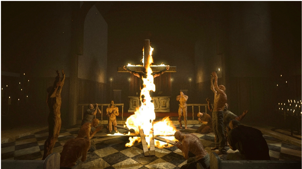
Figure 4 : Les derniers instants du père Martin dans Outlast.

En cela, un partage s'instaure entre observateur et observé. Miles Upshur voit le spectre du Walrider et doute de sa santé mentale ; Waylon Park est soumis aux expériences de Mount Massive et en subit les distorsions visuelles ; Blake Langermann endure les ondes radio psychotropes de Murkoff et devient lui aussi un « projecteur » de visions apocalyptiques. L'horreur contamine le regard, le modifie et le rend suspect, mais elle transforme aussi le point de vue. Miles Upshur, malgré les horreurs qu'il a vu les internés commettre, écrit : « I'm not the only victim here, not by a long shot. I watch a man wait to burn to death, the most painful death imaginable, rather than stay in this place ». L'observateur plongé dans l'horreur souffre dans son esprit et dans sa chair. Miles perd un doigt, Waylon a la jambe transpercée et brisée, Blake est crucifié. Les Outlast retrouvent le lien étymologique qui, par le grec mártus ( Mártus , márturos , « témoin »), unit martyr et témoin. Dès lors, le calvaire du personnage-joueur prend une dimension initiatique soulignée par la figure récurrente du prêtre (Figure 4).