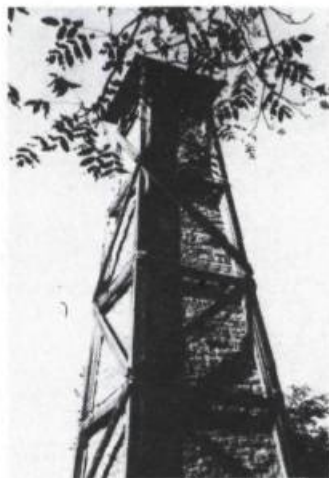
Les Forges du Saint-Maurice