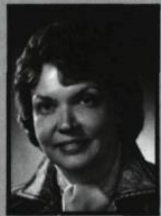
par Gabrielle Poulin