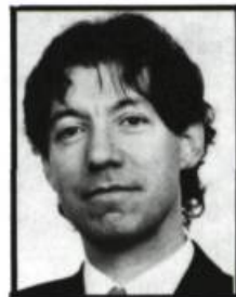
par Michel Lord